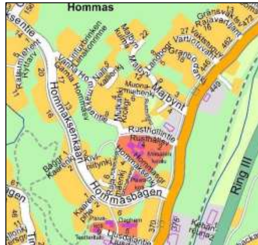
Kirkkonummen opaskartta 2016. Maanmittauslaitoksen luvalla. May

Vuonna 1921 astui yleinen oppivelvollisuus voimaan. Masalaan rakentui tämän jälkeen kaksi ruotsinkielistä alakoulua – vuonna 1925 Luoman Majbyhyn ja vuonna 1927 Hvittorpin- ja Sepänkyläntien risteykseen Nissnikuhun. Majbyn koulun rakennuksen perustukset ovat vielä nähtävissä Rusthollintiellä. Nissnikun rakennuksessa toimii nykyään kunnan ylläpitämä päihdehuollon yksikkö.